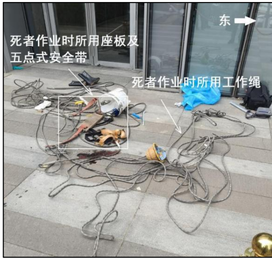
图 1 事故现场地面散落的作业工具