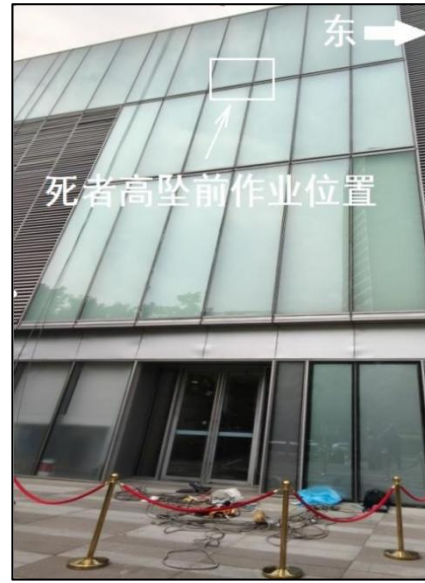
图 2 事故现场周边情况