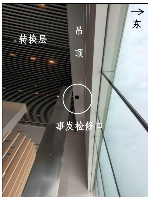
图 3 事发现场情况