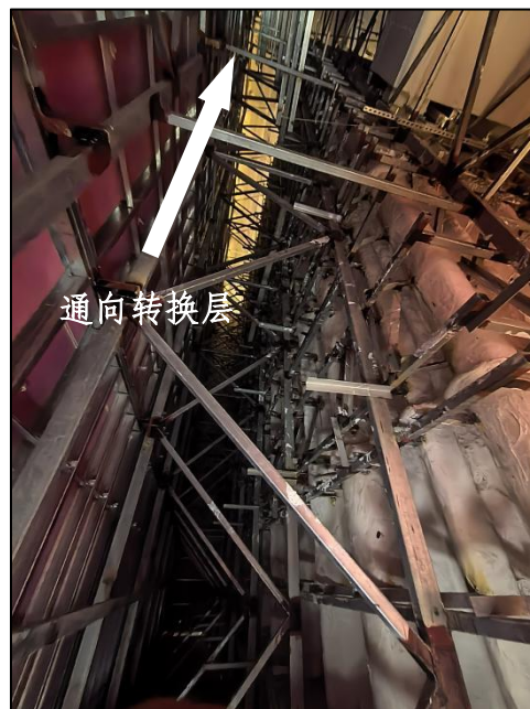
图 4 分集水器间内的墙体钢结构