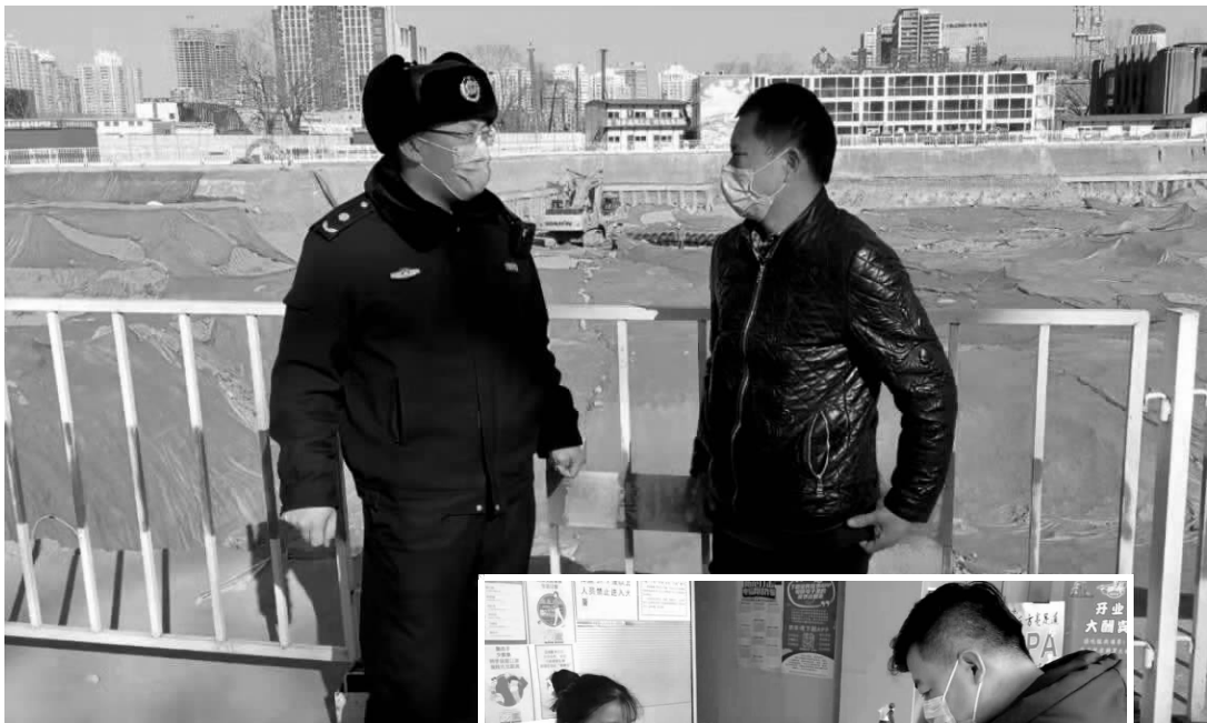
▲综合行政执法队检查辖区工地

除了“抬头”检查户外广告牌安全外,工作人员还“低头”检查土方苦盖,确保无渣土裸露。工作人员针对施工工地等可能造成渣土裸露的区域进行检查,要求负责人做好苦盖和洒水降尘,同时要求在大风天气下,按照规定停止土方作业。