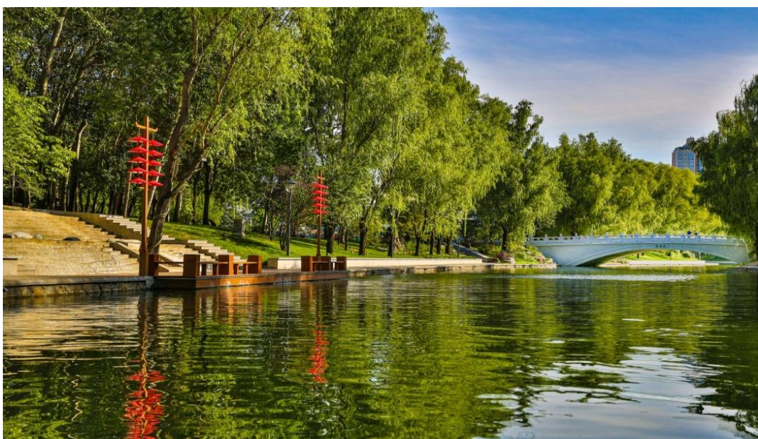
图 3 亮马河通航延伸白浮堰记