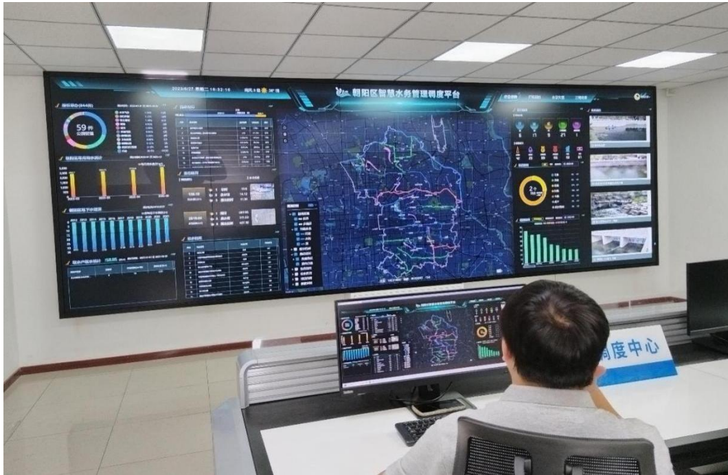
图 6 水系连通智慧调度系统