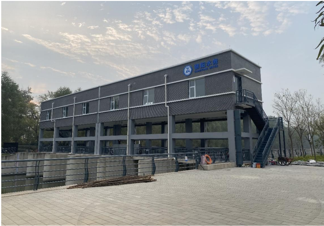
图 8 闸房标准化改造一通惠排干闸房