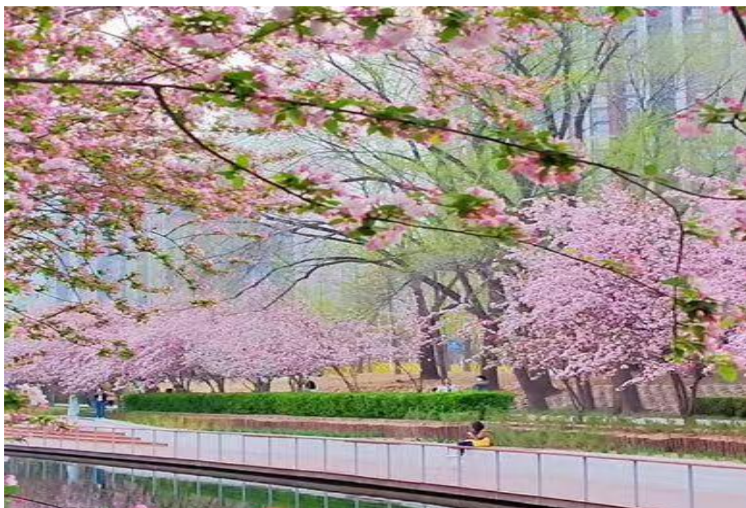
图 5 景观提升一望京沟海棠花溪