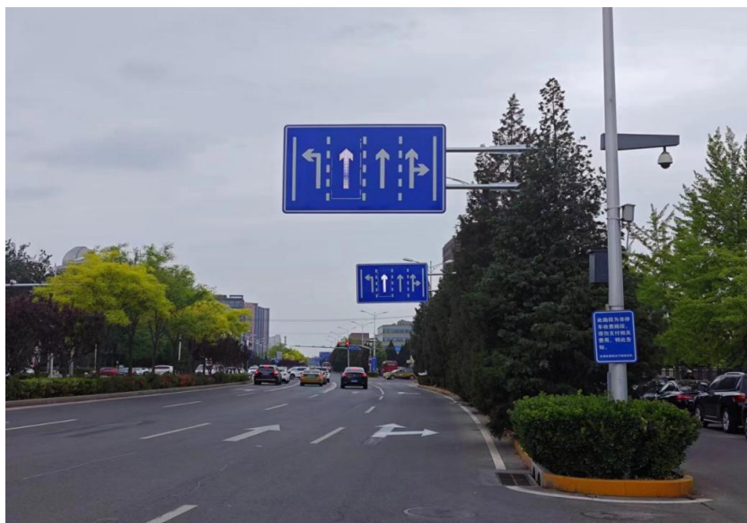
望京北路可变车道