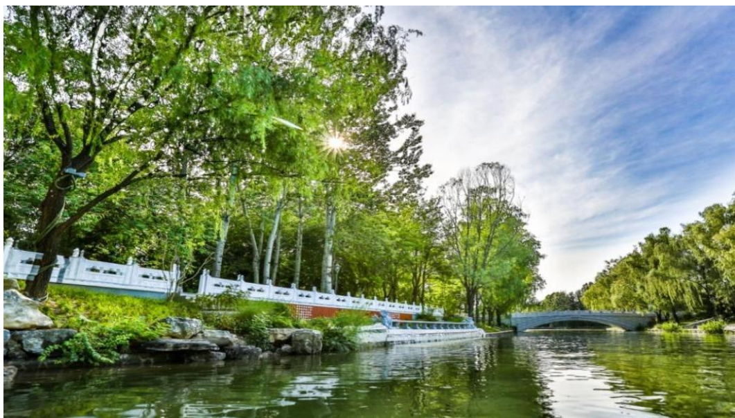
图 2 亮马河通航延伸清漪小景日景