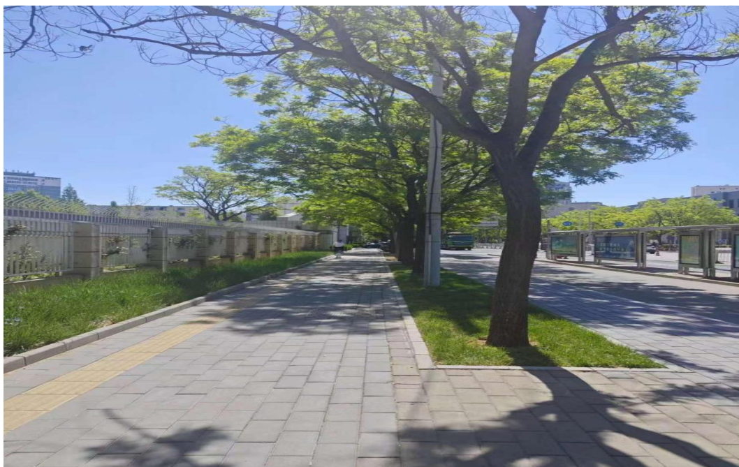
花家地街树池连通