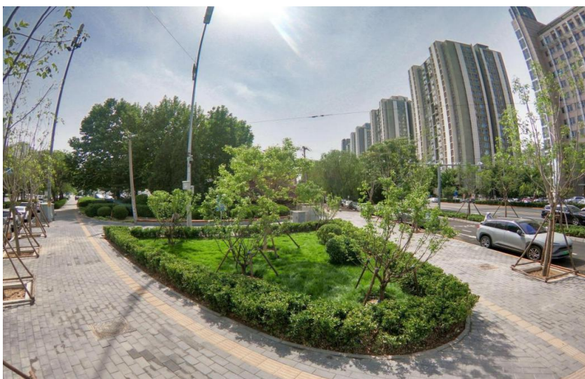
宏昌路与宏泰西路异形路口改造

3.健身大外环（三标段）：完成主体建设及绿化种植工作，实现慢行连通，正在进行节点彩绘及小品安装。完成进度的 80%；目前完成总体进度的 80%，预计年底完工。