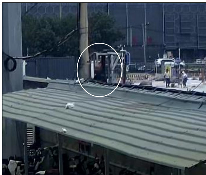
图 2 魏*玉坠落瞬间