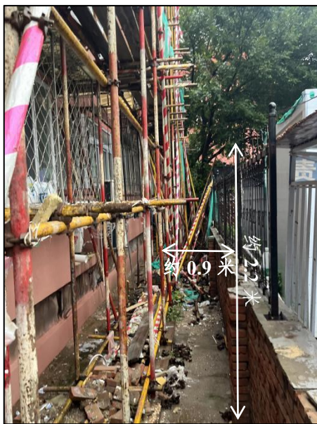
图 1 脚手架与围栏情况