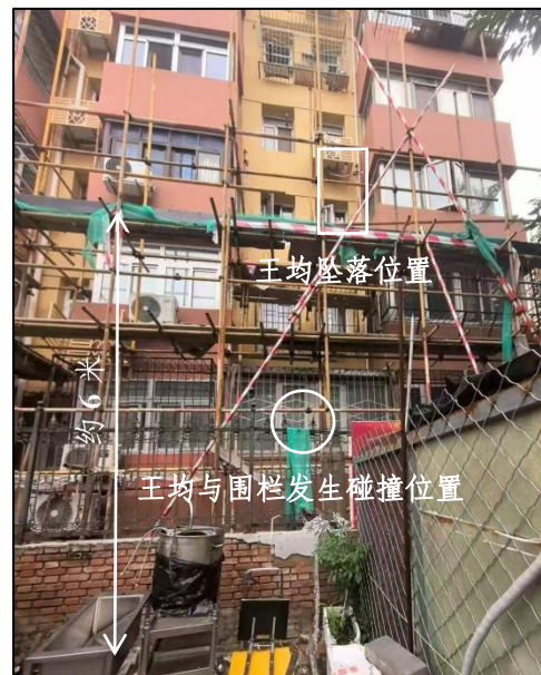
图 3 事发现场情况